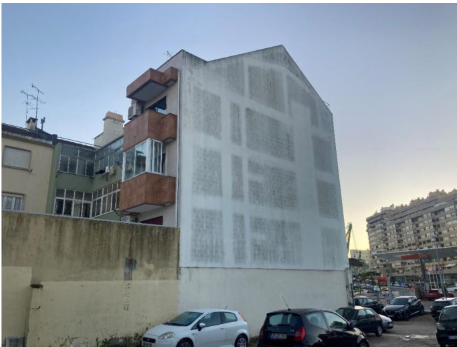
Projeto de um edifício de habitação na Rua António do Couto, Lumiar

LEV.FOT. (2.1.2.1) LEVANTAMENTO FOTOGRÁFICO