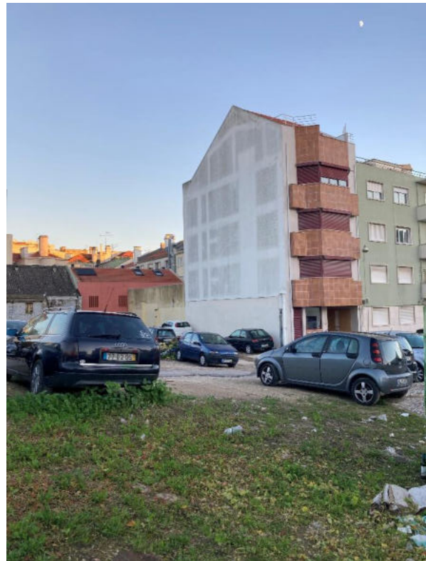
Projeto de um edifício de habitação na Rua António do Couto, Lumiar

LEV.FOT. (2.1.2.1) LEVANTAMENTO FOTOGRÁFICO