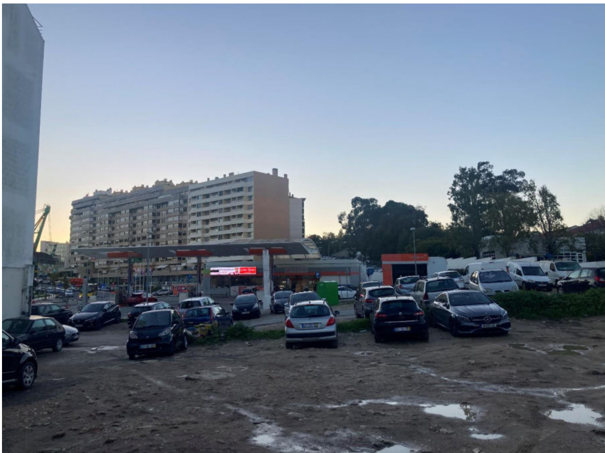
Projeto de um edifício de habitação na Rua António do Couto, Lumiar

LEV.FOT. (2.1.2.1) LEVANTAMENTO FOTOGRÁFICO