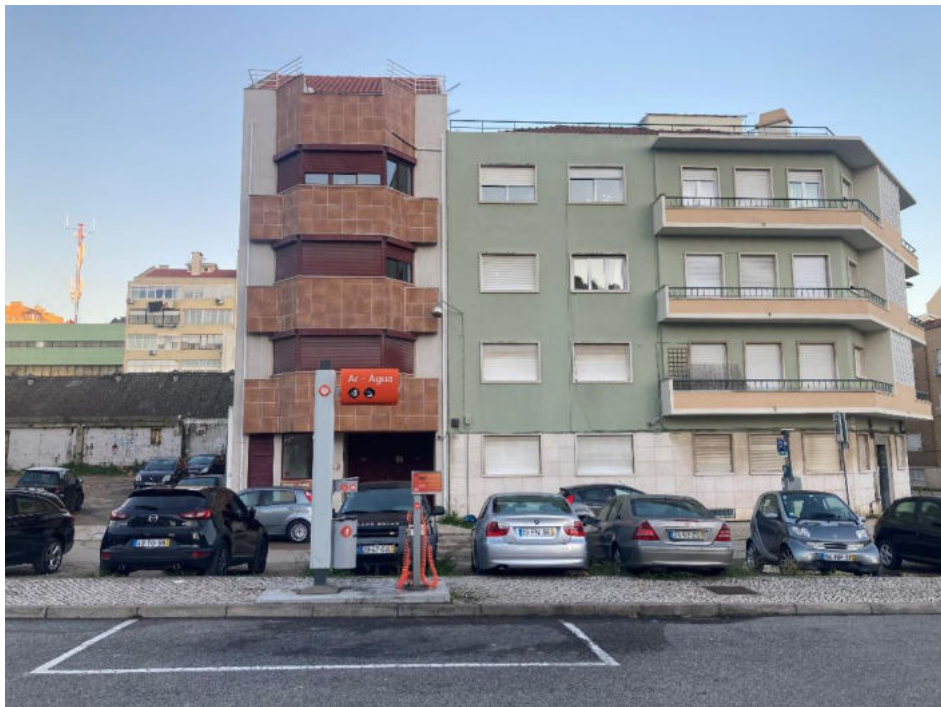
Projeto de um edifício de habitação na Rua António do Couto, Lumiar

LEV.FOT. (2.1.2.1) LEVANTAMENTO FOTOGRÁFICO