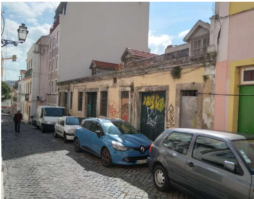
Fotografia da fachada do imóvel