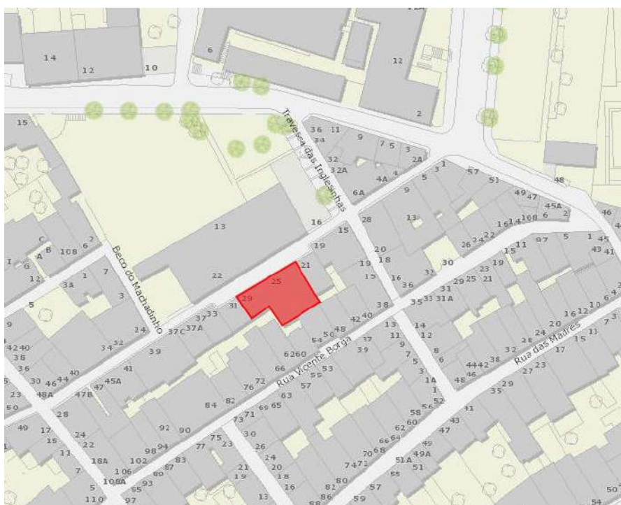
Planta de localização