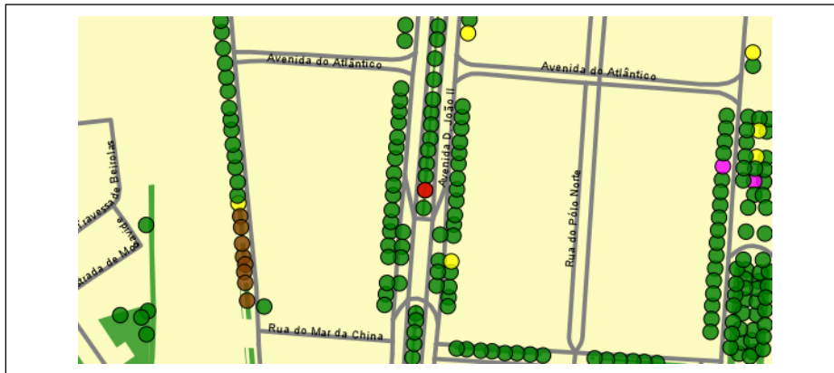
Localização da árvore com cod. SIG 62376: Parque das Nações - Avenida Dom João II