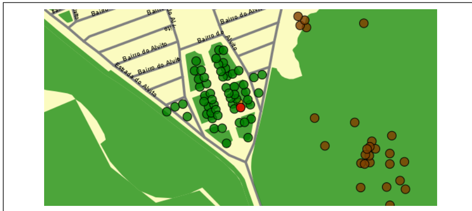
Localização da árvore com cod. SIG 73311: Alcântara - Estrada Estrangeira de Cima