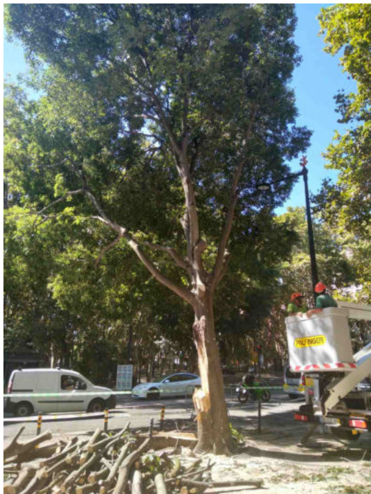
Localização da árvore com cod. SIG 7639: Santo António - Avenida da Liberdade