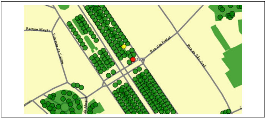
Este documento foi produzido automaticamente pela aplicação SIGU