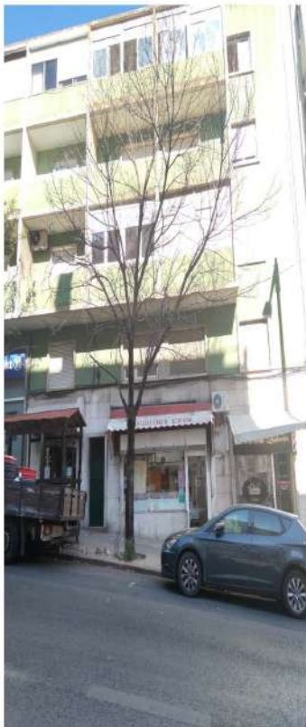
Árvore cod. SIG: 25851