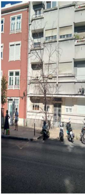
Árvore cod. SIG: 26742

Proposta de localização do exemplar de compensação conforme o disposto no ponto 2 do Despacho 1/GVAFP/2022 .