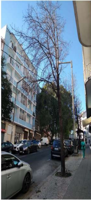
Árvore cod. SIG: 23599