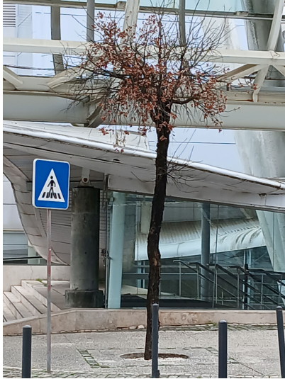
Árvore cod. SIG: 59257