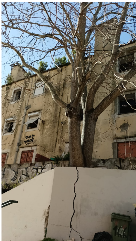
Localização da árvore com cod. SIG 76161: São Vicente - Rua da Graça