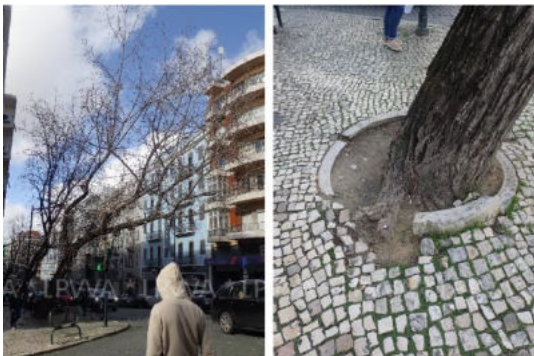
Árvore cod. SIG: 11468