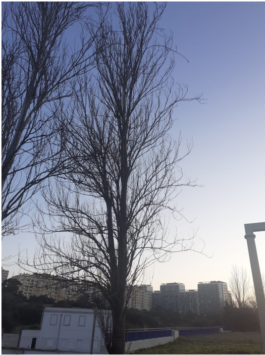
Localização da árvore com cod. SIG 31650: Carnide - Avenida General Norton de Matos