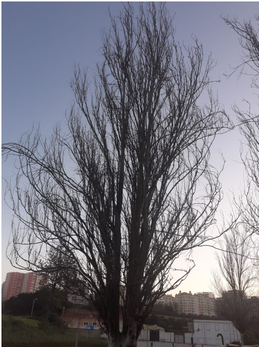
Localização da árvore com cod. SIG 31214: Carnide - Avenida General Norton de Matos