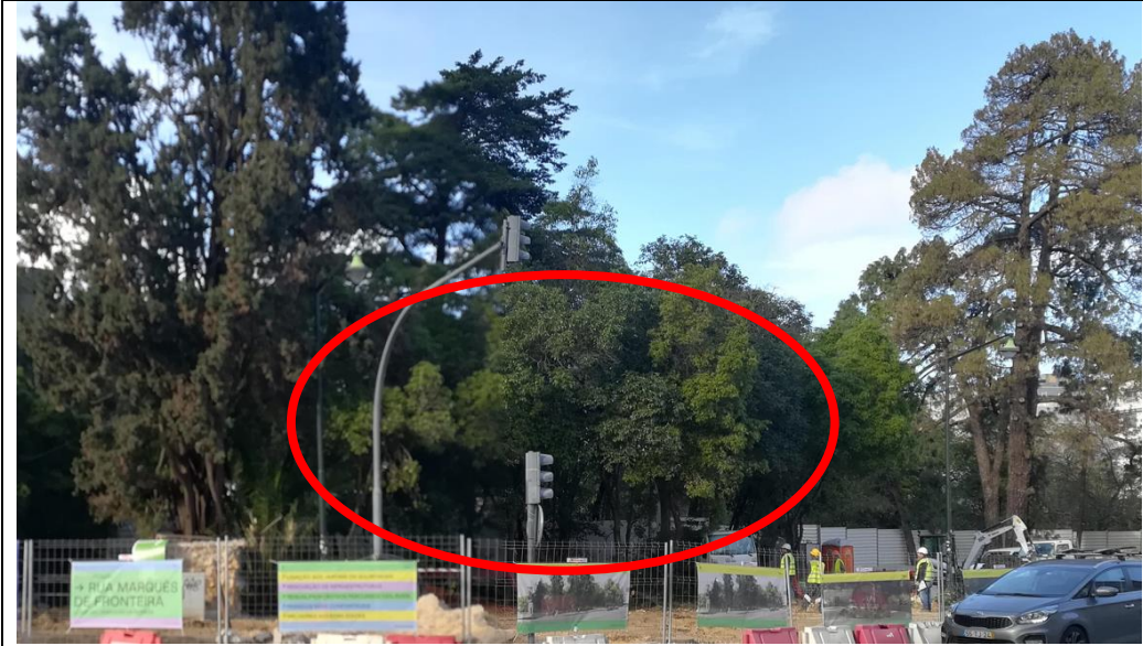
Zona de abates assinalada a encarnado