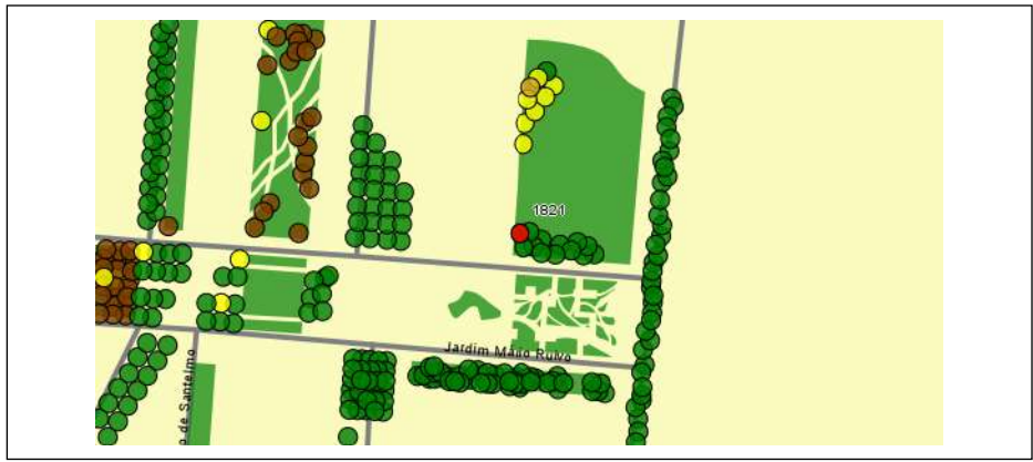
Localização da árvore com cod. SIG 56850: Parque das Nações - Jardins de Água