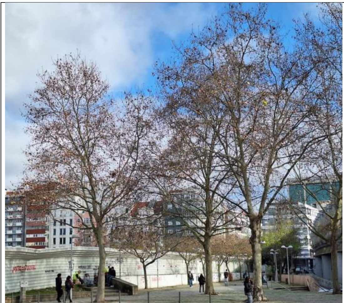
Exemplares 14561 e 15314