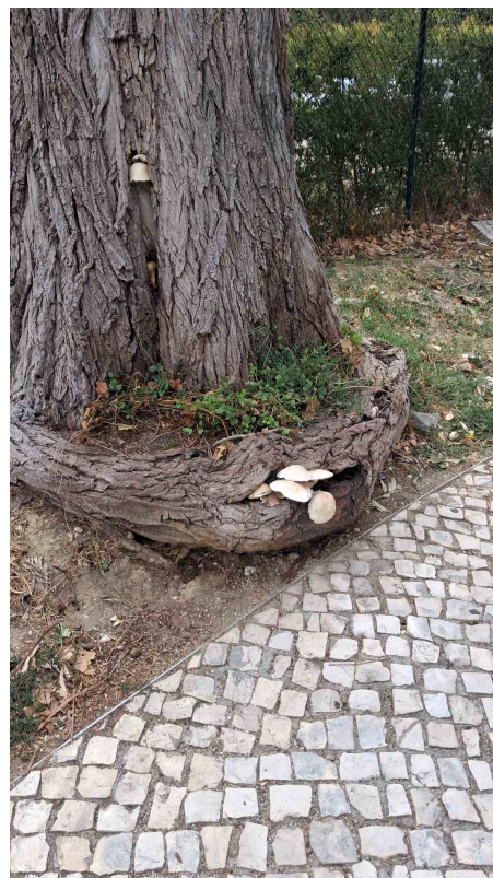
Árvore cod. SIG: 21207