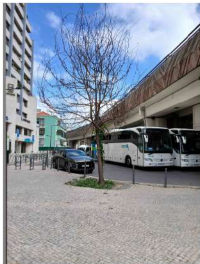
Árvore cod. SIG: 40200