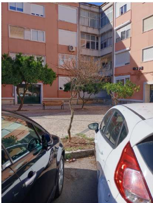
Localização da árvore com cod. SIG 29603: Benfica - Praça Doutor Teixeira de Aragão