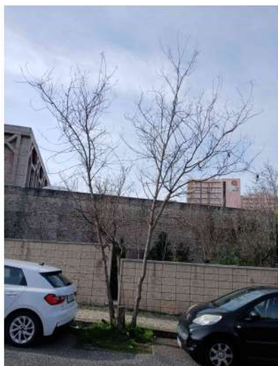
Localização da árvore com cod. SIG 38526: São Domingos de Benfica - Eixo Norte-Sul