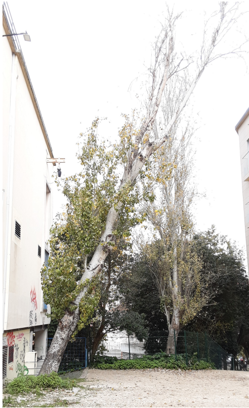
Localização da árvore com cod. SIG 14492: Areeiro - Avenida de Madrid