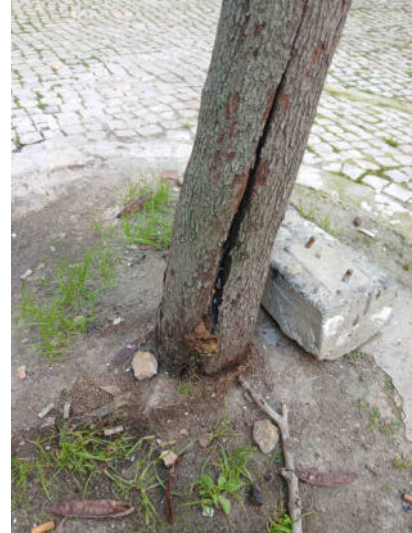
Árvore cod. SIG: 68789