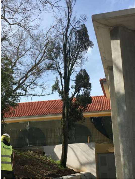
Árvore cod. SIG: 64836