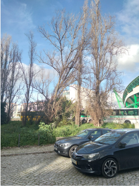
Localização da árvore com cod. SIG 81488: Lumiar - Avenida Padre Cruz