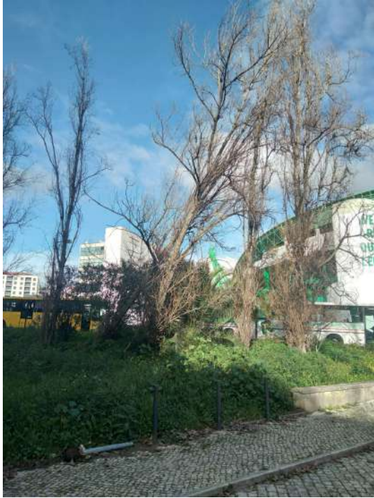
Localização da árvore com cod. SIG 81487: Lumiar - Avenida Padre Cruz