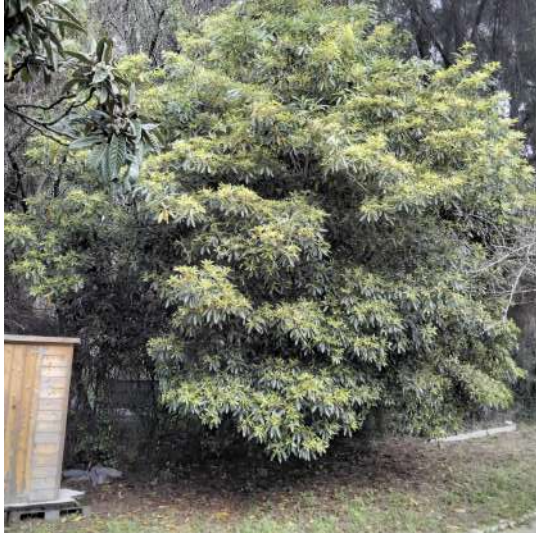
Localização da árvore com cod. SIG 81495: Alvalade - Palacio Pimenta