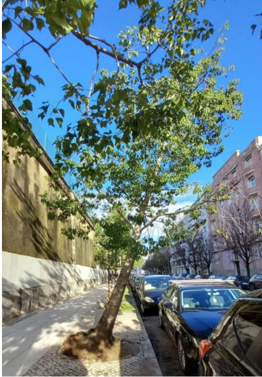
Árvore cod. SIG: 10420