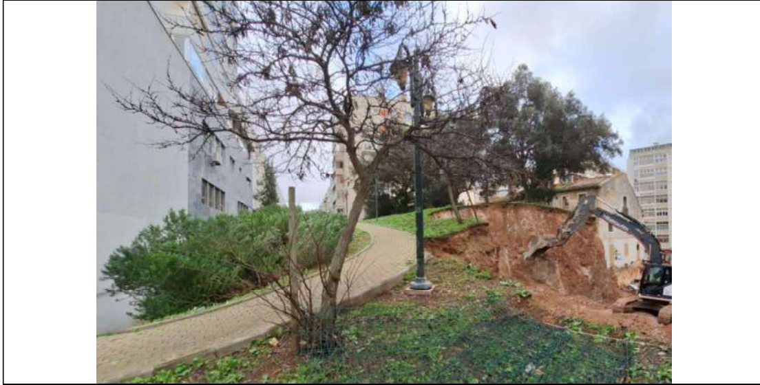
Vista geral da zona já em obra e árvores a transplantar.