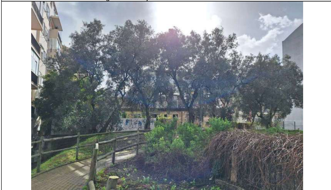
Vista geral dos exemplares da espécie Olea europaea sylvestris .