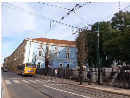
Árvore cod. SIG: 21825