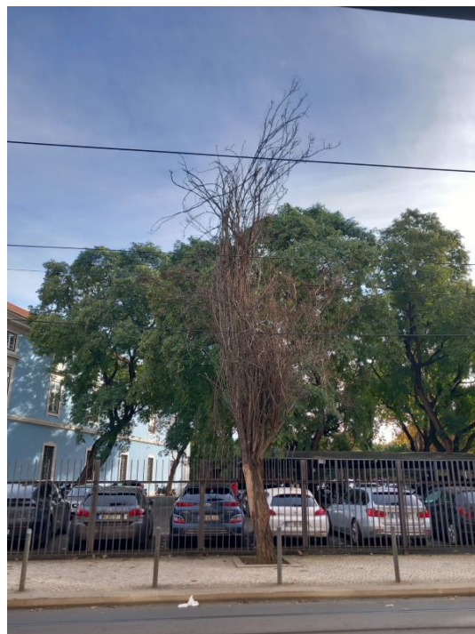
Árvore cod. SIG: 22600