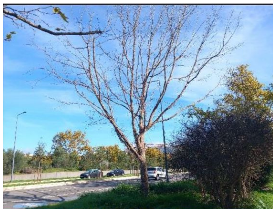
Localização da árvore com cod. SIG 86039: Campolide - Avenida Calouste Gulbenki