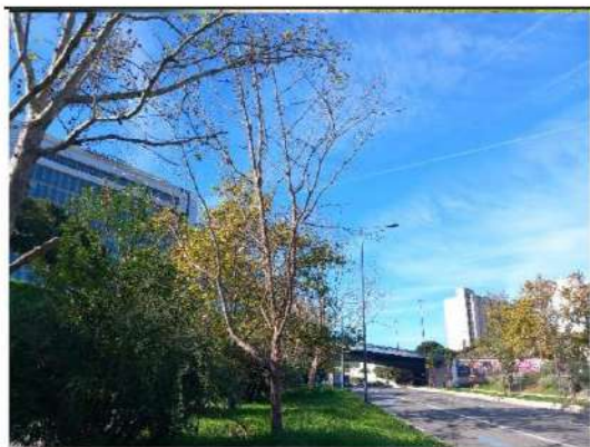
Localização da árvore com cod. SIG 86040: Campolide - Avenida Calouste Gulbenki