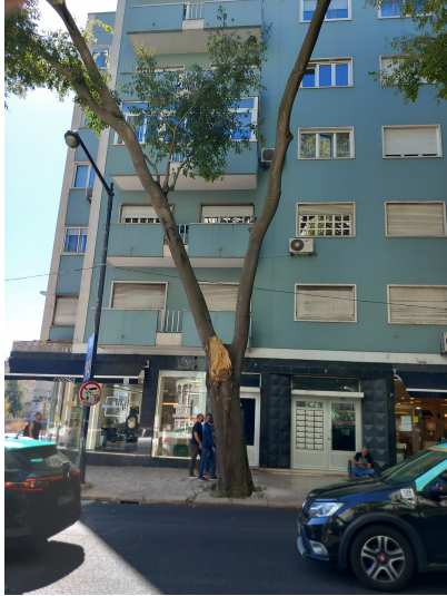
Localização da árvore com cod. SIG 9337: Arroios - Rua de Pascoal de Melo