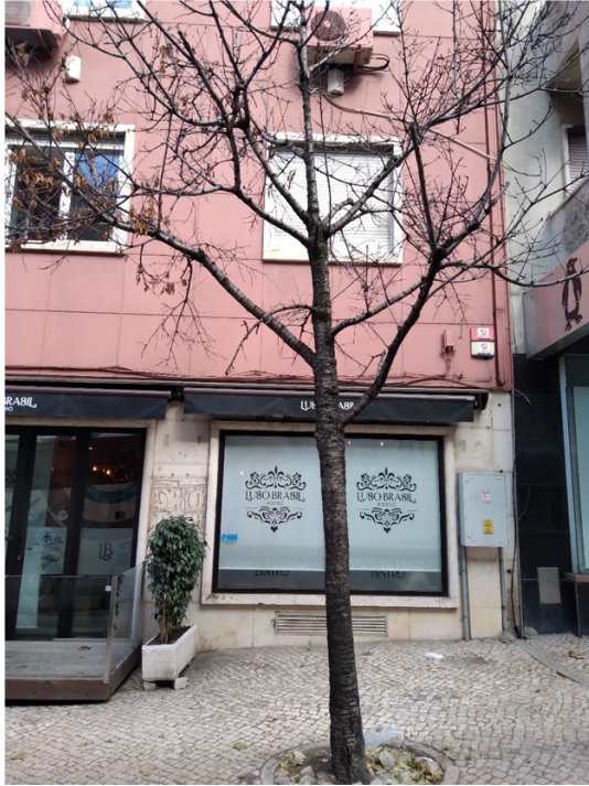
Localização da árvore com cod. SIG 12001: Santo António - Rua do Conde de Redondo