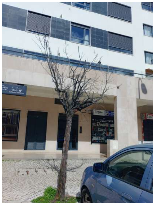
Árvore cod. SIG: 34572