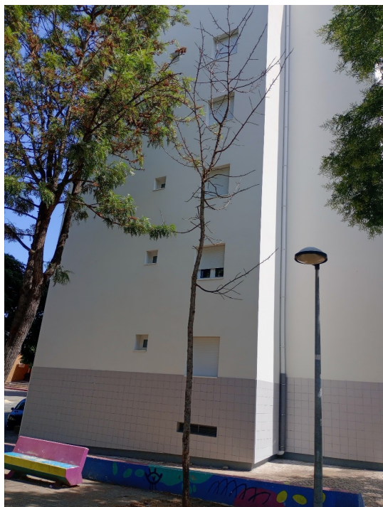
Localização da árvore com cod. SIG 30851: Benfica - Rua Rainha D. Maria I