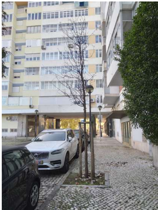
Árvore cod. SIG: 74542