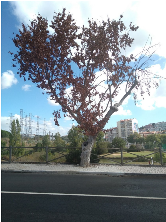
Localização da árvore com cod. SIG 38955: Lumiar - Rua Formosinho Sanchez