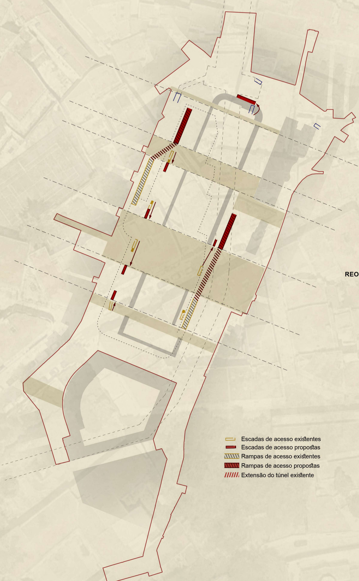
REORGANIZAÇÃO DAS SAÍDAS SUBTERRÂNEAS