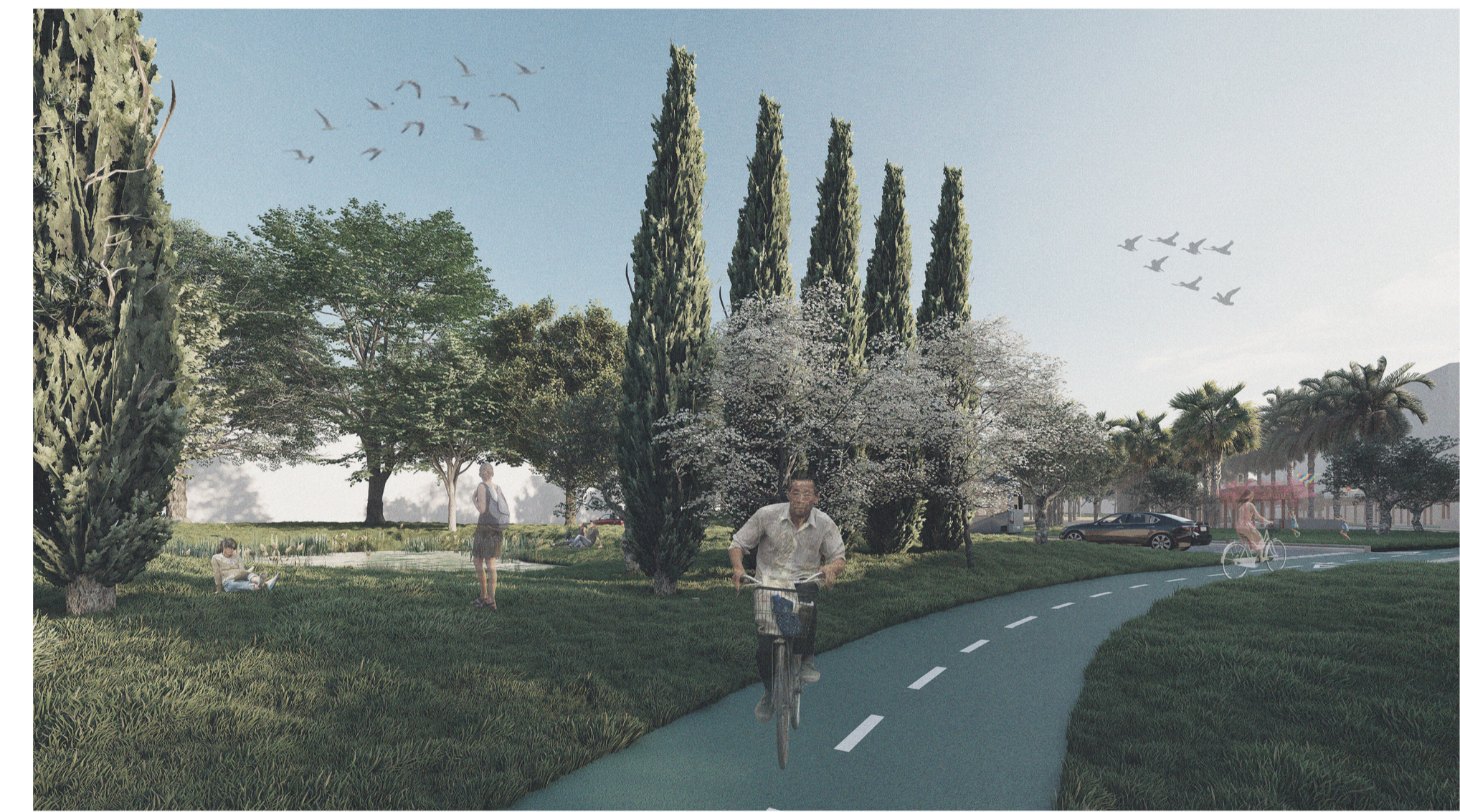
Ciclovia no atravessamento da nova rotunda, com palmeiral ao fundo.