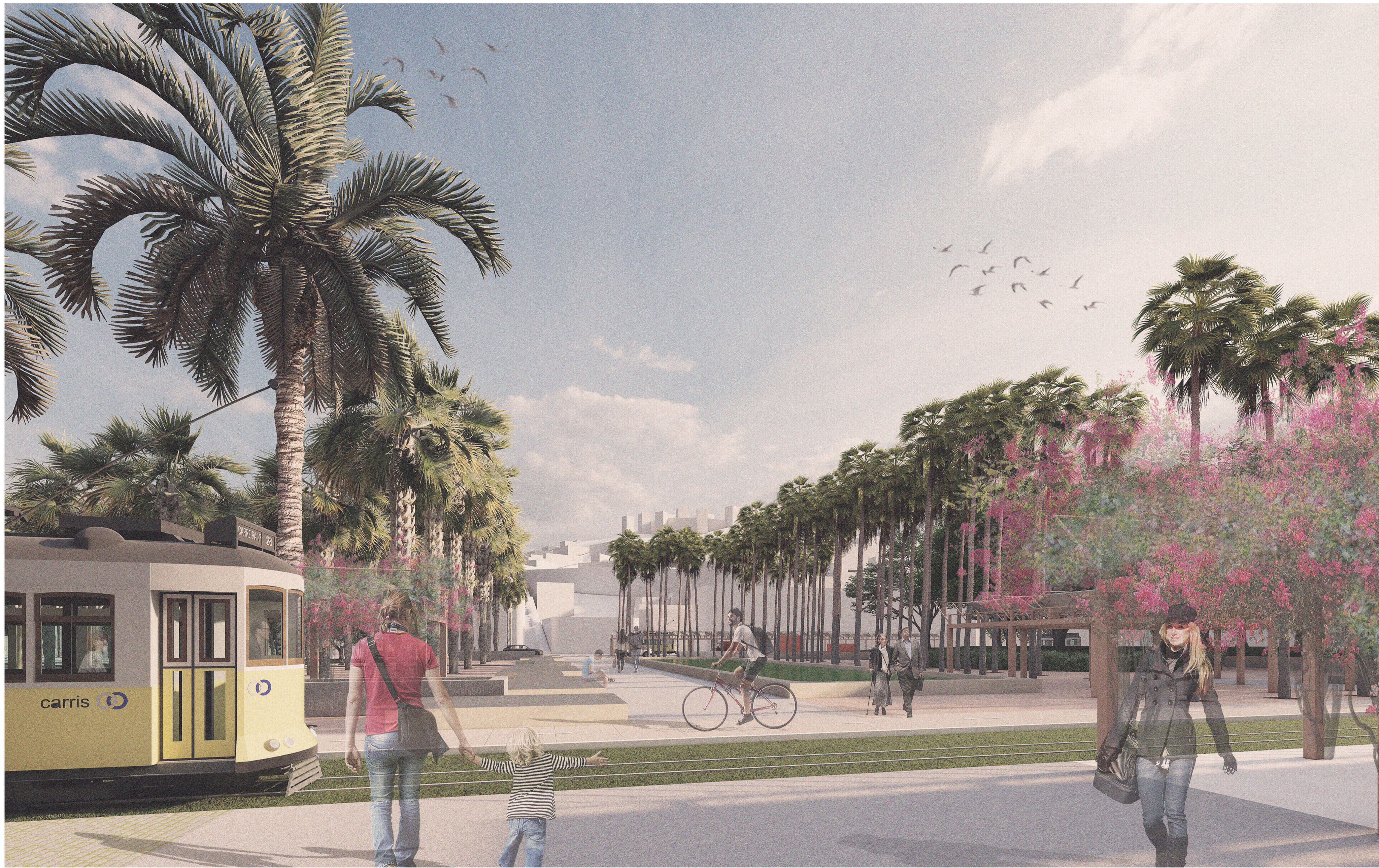
Alinhamento que marca o antigo traçado da muralha fernandina e enquadra vistas sobre a Mouraria e o Castelo.