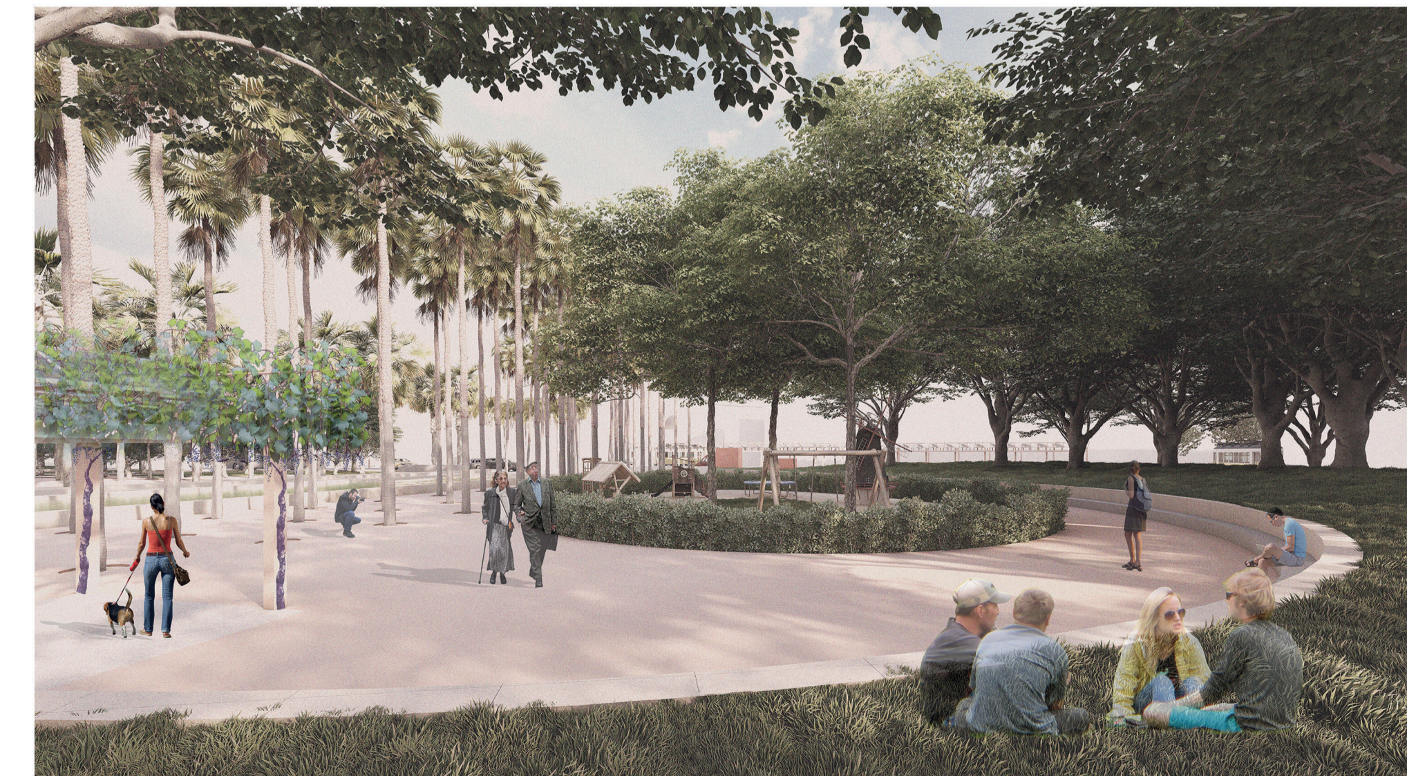
Parque infantil com poço drenante ao centro.