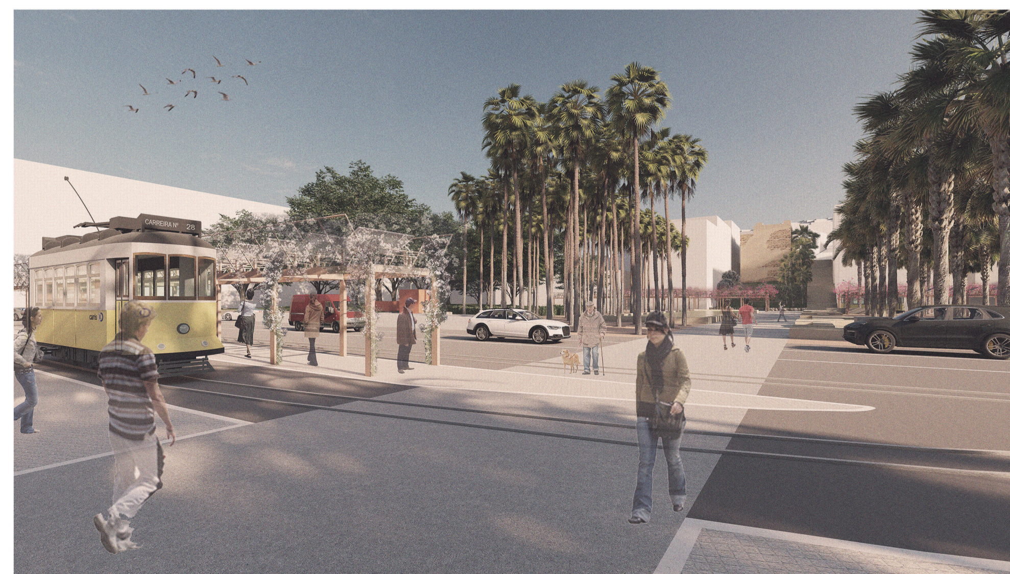
Eixo transversal de ligação entre colinas a partir do lado nascente, olhando para a Torre da Péla ao fundo.