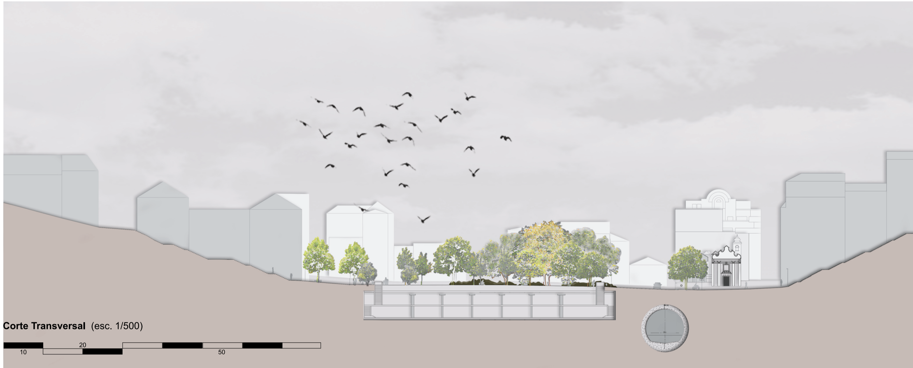
Corte Transversal (esc. 1/500)