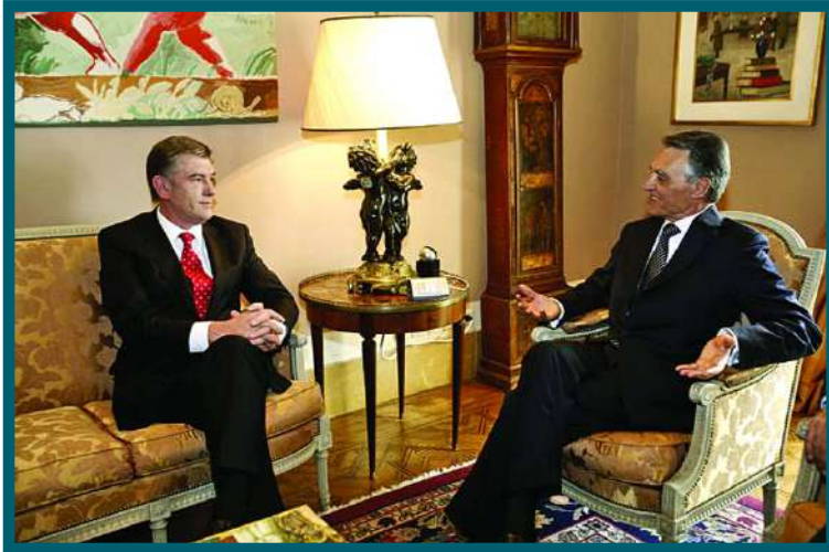
Cavaco Silva e Viktor Yushchenko, em Belém

Leonid Kravchuk foi o primeiro presidente deste novo país, sucedendo-lhe Leonid Kuchma, em 1994 e Viktor Yuschenko em 2004.