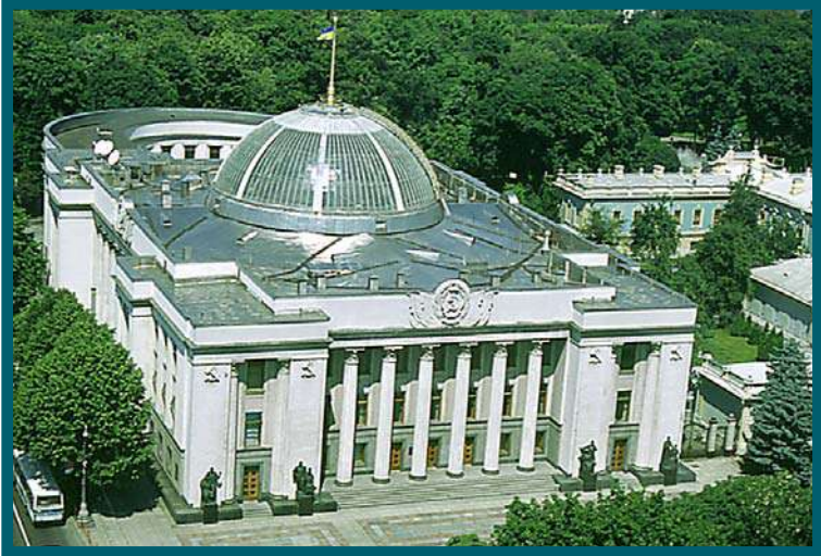
Verkhovna Rada - Parlamento da Ucrânia

No século XVIII a Rússia consegue apoderar-se definitivamente do território ucraniano, exceptuando a Galícia, absorvida pela Áustria. Só no século XX, depois da Revolução Russa de 1917, o movimento nacional ucraniano, no início de 1918, proclamou a independência.