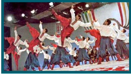
Virsky - Ballet Nacional da Ucrania 1

poeta que chegou a ser considerado o pai da literatura nacionalista. Kobzar foi o seu primeiro livro de poesias (publicado em 1840), considerado como uma das maiores obras da literatura ucraniana. Este título refere um antigo instrumento de corda que simboliza a variada herança ucraniana. Na sua culinária estão presentes, o frango, a carne de vaca e a de porco, cogumelos e grande variedade de legumes como a batata e a couve. Na cozinha tradicional está incluído o vareniky (com batatas, cogumelos, chucrute, queijo ou cerejas) e a famosa borsh (sopa de beterraba). As especialidades ucranianas são o frango e o bolo de Kiev (Kyiv). As bebidas ucranianas são semelhantes ao resto da Europa, destacando-se a gorilka (aguardente/vodka).