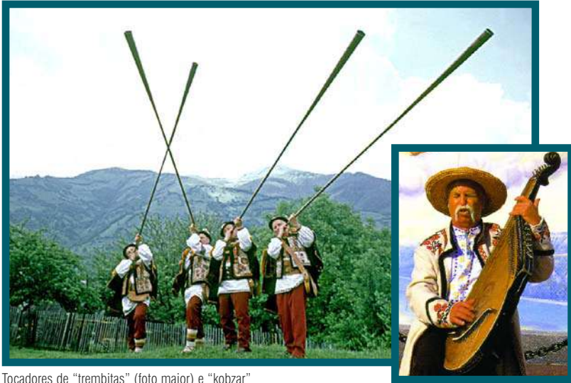
Tocadores de "trembitas" (foto maior) e "kobzar"

A grande importância económica da Ucrânia deve-se à presença de ricos jazigos mineiros, entre os quais: carvão e minério de ferro, para além de estar largamente industrializada, especialmente no sector da indústria pesada aeroespacial e no desenvolvimento de infra-estruturas. A unidade monetária é: Hryvnia da Ucrânia (UAH).