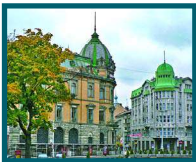
Centro de Lvov (Lviv)