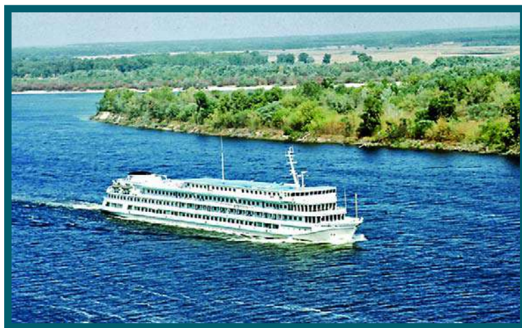
Rio Dniepre (Dnipró)

Do ponto de vista físico, trata-se de um país predominantemente plano, apenas montanhoso na região de bosques dos Cárpatos e a sul da Crimeia. A noroeste está coberto de extensas florestas e nas amplas bacias fluviais predominam áreas pantanosas. No entanto, a natureza modifica-se à latitude de Kiev (Kyiv), começando então a estepe de bosques, onde a floresta abre clareiras de terreno mais escuro, rico em húmus que aumenta a sua fertilidade. Aqui