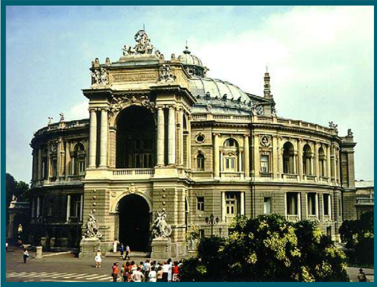
Teatro da Ópera (Odessa)

margens do rio Dniepre (Dnipró), é também um importante centro industrial (metalurgia, siderurgia, maquinaria e cimento) e de comércio de trigo; Odessa , situada junto do Mar Negro, para além de ser um importante centro portuário e turístico é também um centro industrial de produtos alimentares, maquinaria, navios e derivados de petróleo e aço. Possui uma notável vida cultural, destacando-se o Teatro da Ópera; e Lvov (Lviv), situada próximo da fronteira com a Polónia, retrata a diversidade de estilos arquitectónicos dos seus edifícios, como ucraniano, austríaco e o moderno.