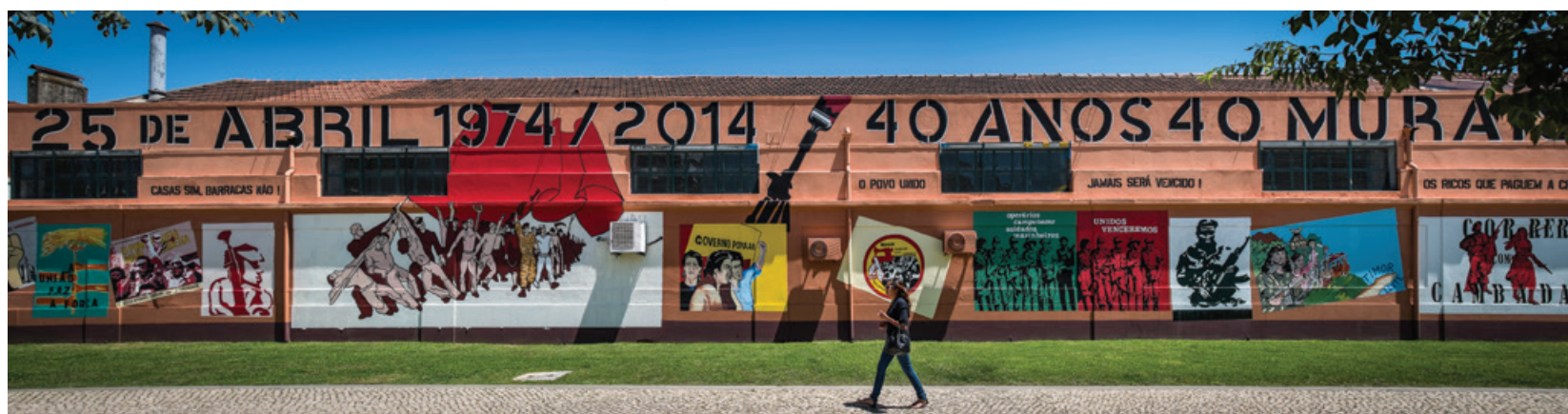
40 anos 40 murais - muro municipal da Rua Cais de Alcântara