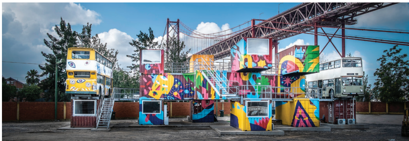
akaCorleone e Kruella D'Enfer - Village Underground Lisbon, Museu da Carris, Alcântara