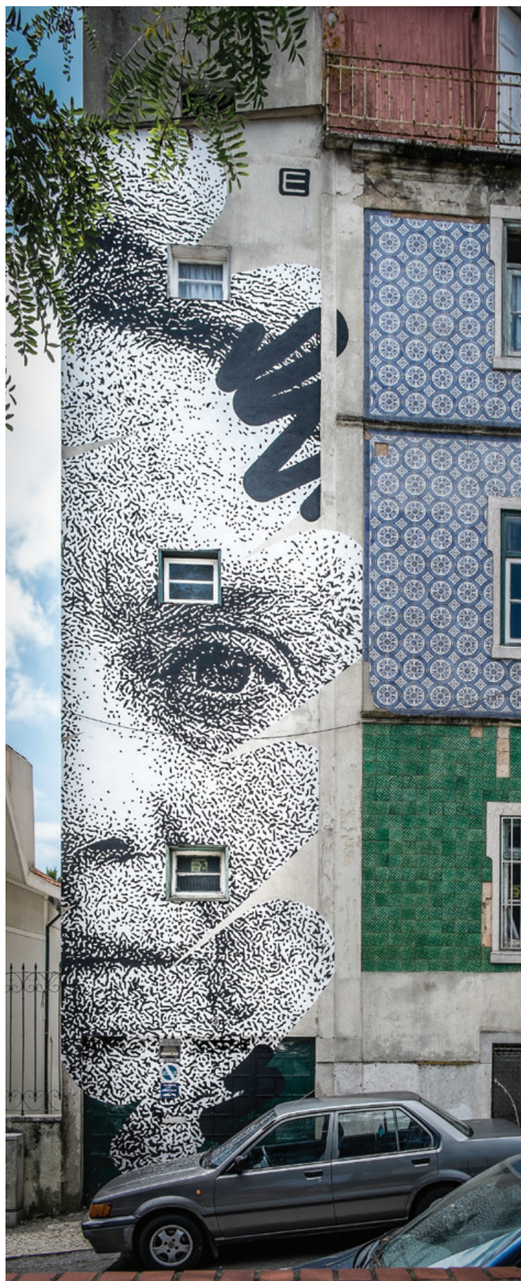
EIME - Rua Josefa de Óbidos