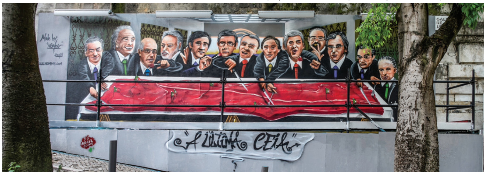
Nomen - Exposição "Venham mais Sete!", painéis da Calçada da Glória e Largo da Oliveirinha