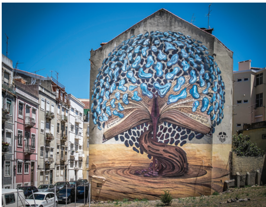
Violant - Rua Josefa de Óbidos