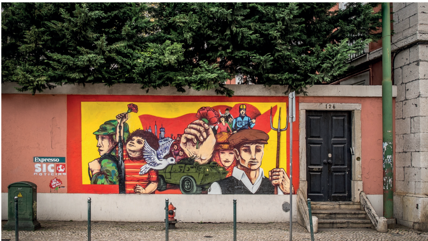
Gonçalo MAR - Mural Expresso e SIC Noticias, Rua 1º de Maio