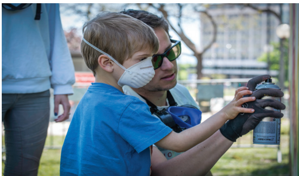
Dupla Edis One e Timtim - Workshop de arte urbana no Parque Eduardo VII