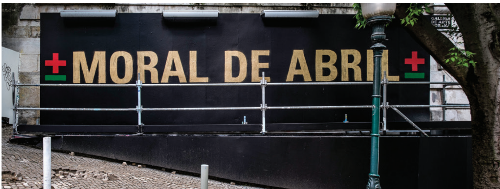
± MaisMenos ± - Exposição "Venham mais Sete!", painéis da Calçada da Glória e Largo da Oliveirinha