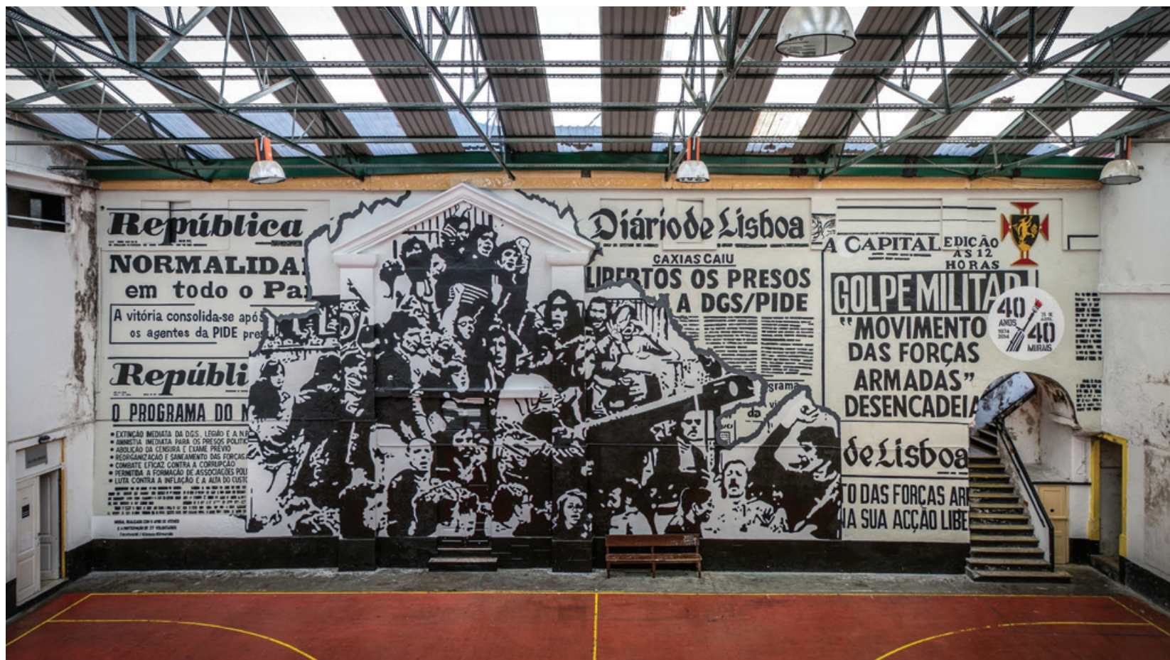
40 anos 40 murais - Ateneu de Lisboa