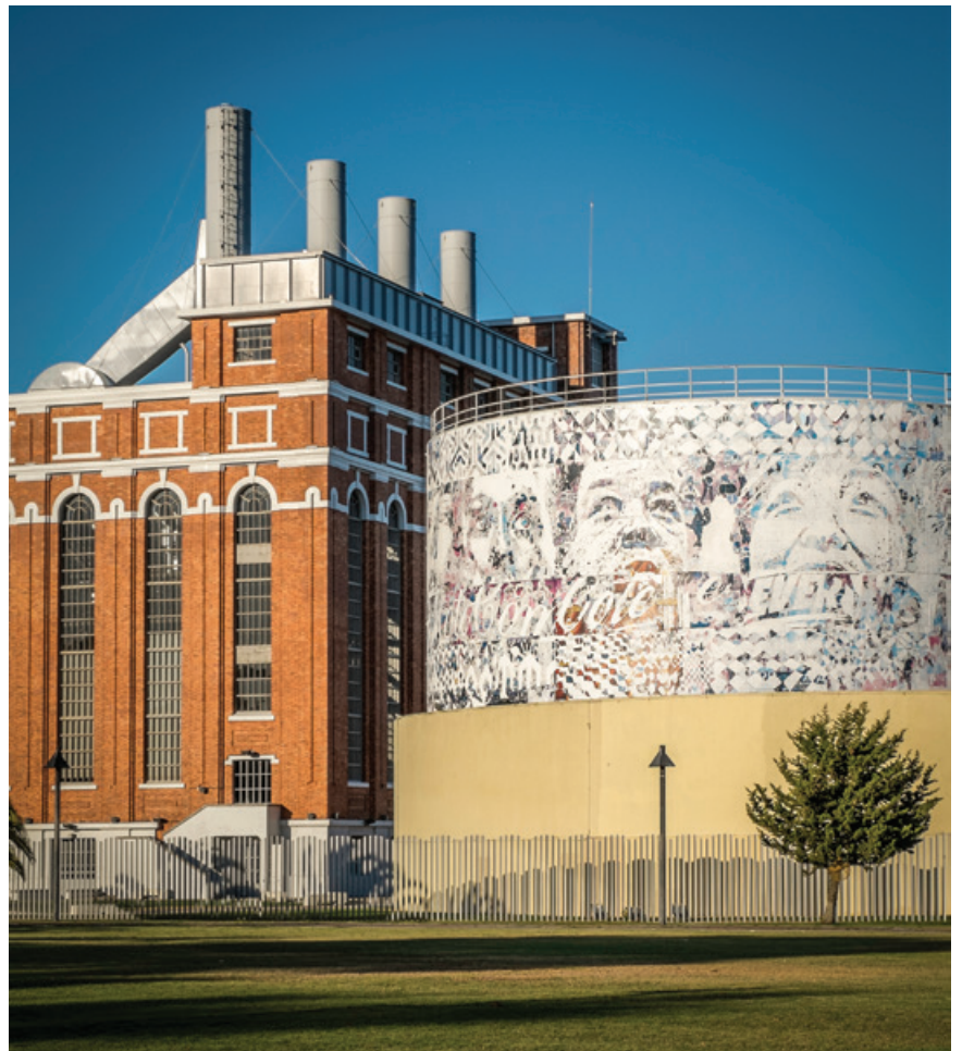
Vhils - Fundação EDP - Museu da Eletricidade