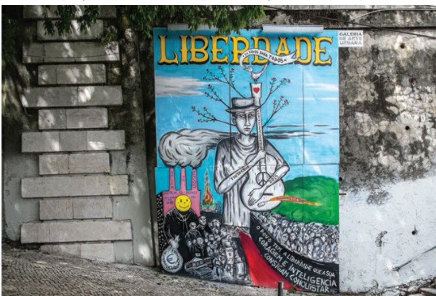
Tinta Crua - Exposição "Venham mais Sete!", painéis da Calçada da Glória e Largo da Oliveirinha