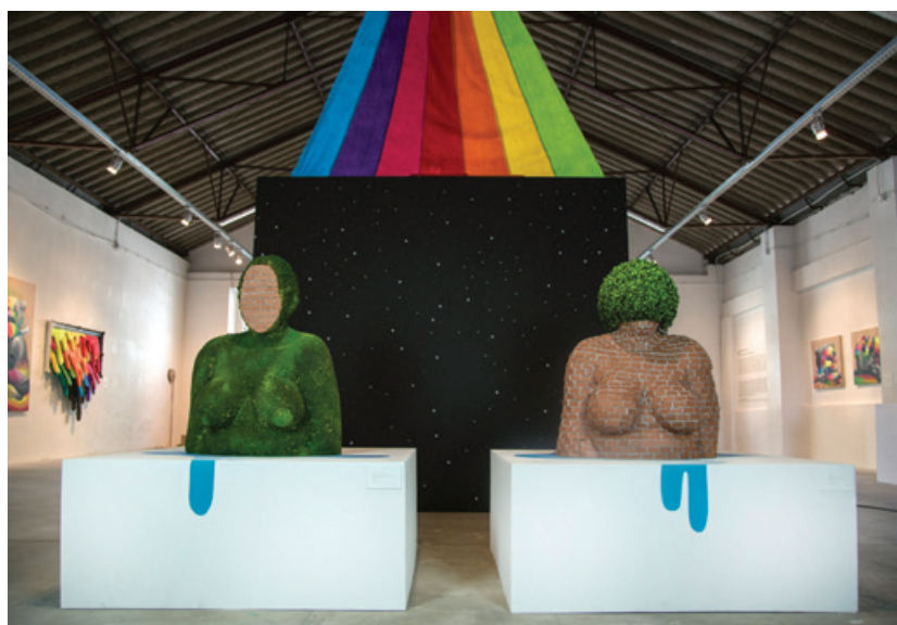
Okuda - Galeria Underdogs, Rua Fernando Palha, armazém 56