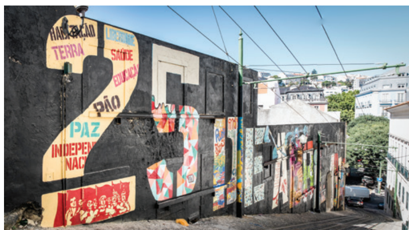
40 anos 40 murais - Calçada do Lavra