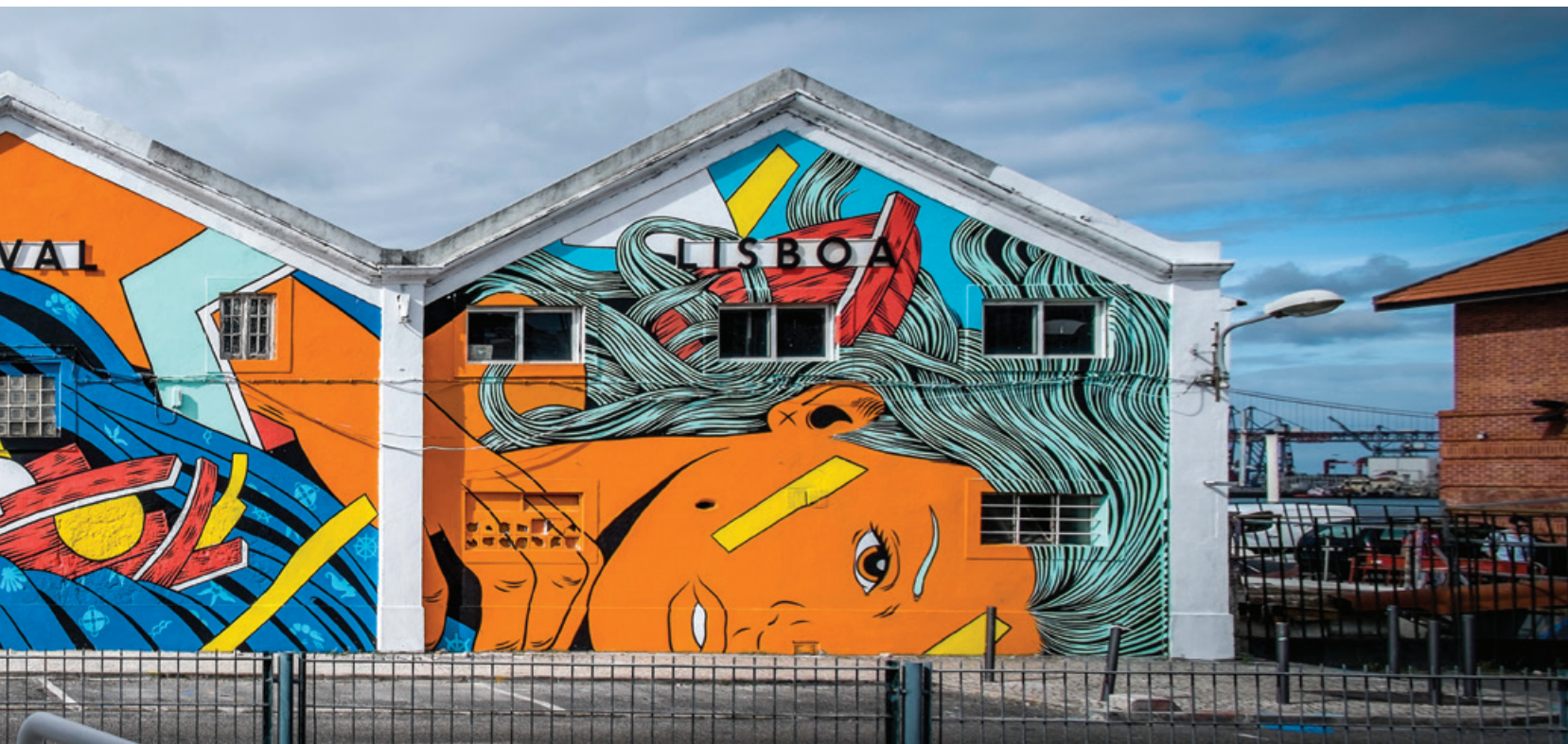
Bicicleta Sem Freio - Clube Naval de Lisboa, Cais do Gás