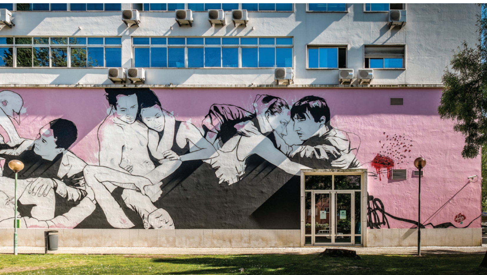
Tamara Alves - fachada norte do edifício Fórum Lisboa, sede da Assembleia Municipal de Lisboa, Av. de Roma