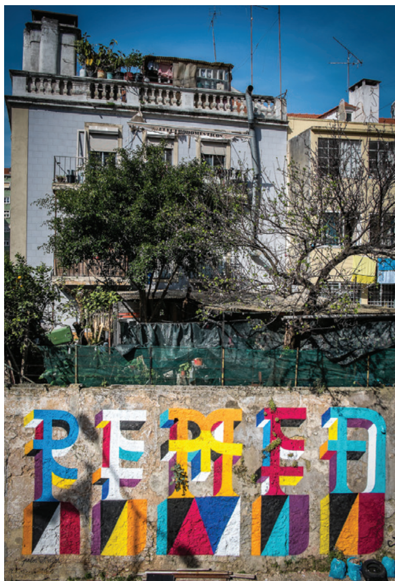
Remed - Regueirão dos Anjos